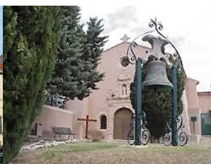
St Pierre à Liens