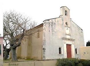
Chapelle Notre Dame de Pitié