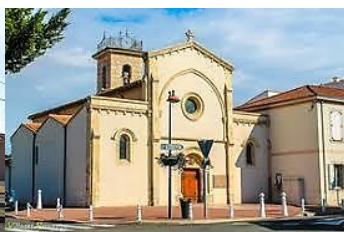
St Laurent Imbert